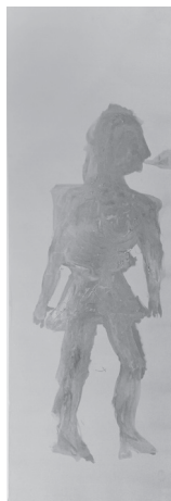
Theorien 2023 Pigment und Acryl auf Synthetik 120 x 40 cm

The materials are acrylic, scented wax, silk, lacquer, polyester, oil, pigment, cotton and a Rubens book.