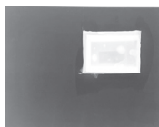
ohne Titel 2023 Fotografie, Duftwachs, Öl und Pigment auf Seide 35 x 45 cm