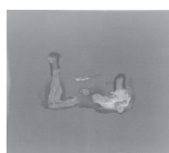
ohne Titel 2023 Acryl, Öl und Pigment auf Baumwolle 35 x 40 cm